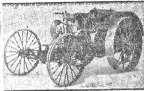
El tractor "BEAN"