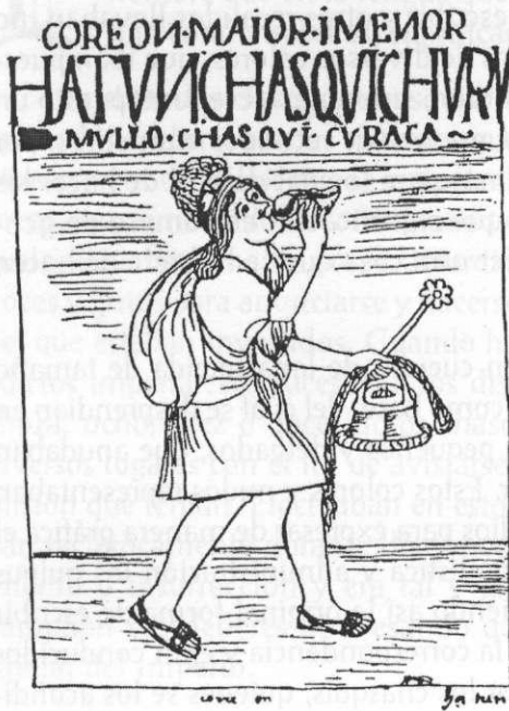
"Coreo maior i menos Hatunchasquichuru. Mullo Chasqui curaca". Chasqui con su indumentaria, cesta, mazo, pututo (concha marina, que servia para dar aviso de su llegada). Dibujo de Huamán Poma de Ayala.

He querido hacer esta pequeña reseña del servicio que realizaban los Incas, para entender que los españoles que conquistaron estas tierras no tuvieron que establecer caminos nuevos, pues el Imperio de los Incas contaba con una gran red vial que en vez de continuarla o tal vez mejorarla, adecuándola a sus necesidades, la destruyeron, perdiéndose así una de las más sofisticadas vías construidas por el hombre antiguo.