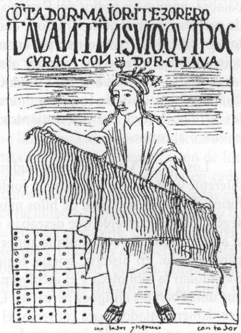
"Contador maior i tezorero Tauantinsuio Quipoc Curaca condor chava". Dibujo de Huamán Poma de Ayala.